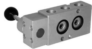
● Powrót sprężyną