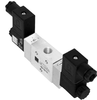
● Przesterowanie ciśnieniem obcym (przyłącza M5)