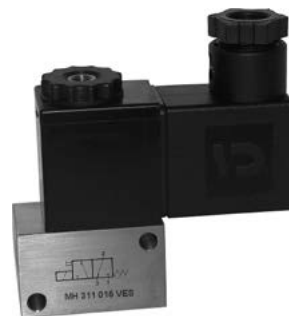
● Zawór ze stali nierdzewnej