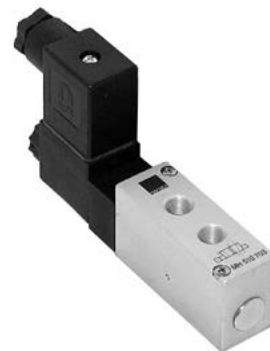
● Montaż przylgowy