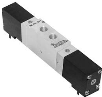
● Montaż przyłgowy - terminalowy